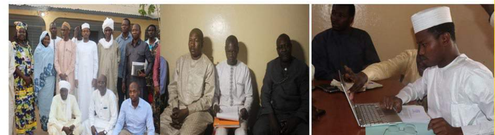
DOBA: PHOTO DE FAMILLE AVEC L'EQUIPE DU CPI ET MISE EN PLACE DE L'EQUIPE DE CONTROLE