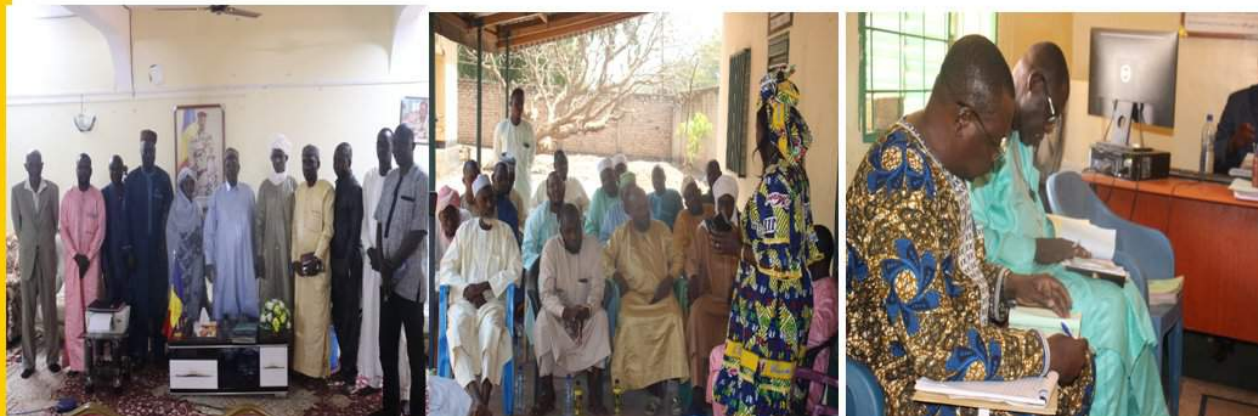
KOUMRA: CIVILITES AU GOUVERNEUR , SENSIBILISATION DES CONTRIBUABLES ET CONTRÔLE AU CPI