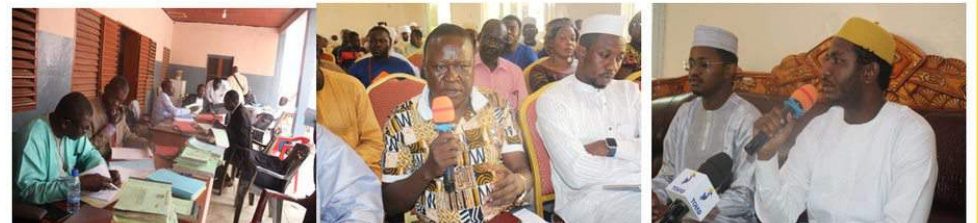
MOUNDOU: CONTRÔLE, SENSIBILISATION ET INTERVENTION DU GOUVERNEUR