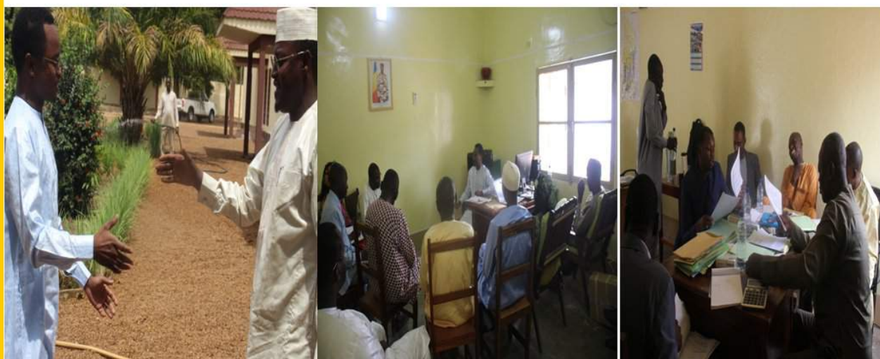
SARH: CIVILITES AU GOUVERNEUR, CONSIGNES DE TRAVAIL, CONTROLE