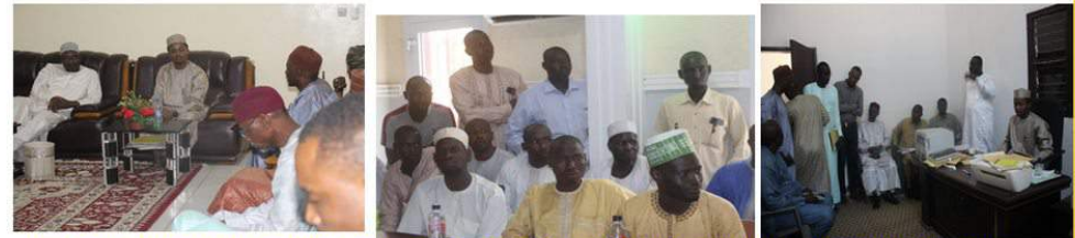
BONGOR: CIVILITES AU GOUVERNEUR, SEANCE DE SENSIBILISATION, MISE EN PLACE POUR CONTROLE