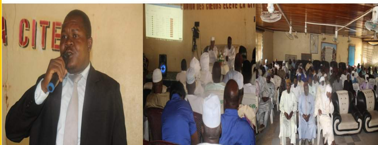
SARH: INTERVENTION DU SG DU DEPARTEMENT DE BARH KOH, INTERVENTION DU DGI/A, SENSIBILISATION